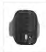
Bezprzewodowy przycisk PTT na palec