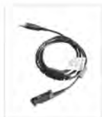
Kabel do programowania (port USB) PC45